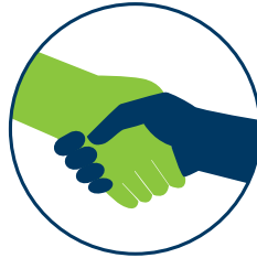
Relações de Valor